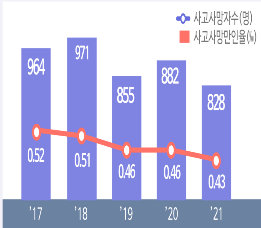
우리나라 사고사망 현황